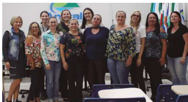
Integrantes do Colegiado de Assistência Social

No dia 24 de julho, membros do Colegiado Estadual de Assistência Social (COAS) se reuniram na cidade de Treze Tílias, onde também ocorreu o II Seminário Estadual de garantia de Direitos. O encontro teve o objetivo de discutir questões sobre os repasses do Fundo Estadual de Assistência Social (FEAS) buscando firmar parceria com o Estado para transferências desses recursos que beneficiam os municípios na entrega dos serviços socioassistenciais. Representantes de todos os Colegiados de diversos municípios de Santa Catarina que se mobilizam há anos para que essa parceria seja realizada. Em continuidade a essa mobilização, no dia 12 de agosto, durante a visita do Governador de Santa Catarina, Carlos Moisés, em Jaraguá do Sul, o Colegiado de Assistência Social da Amvali, entregou ao Governador, um ofício com os principais pleitos do setor na região. Esses e outros esforços em união com a Fecam, resultaram no dia 20 de novembro, a aprovação da Lei que regulamenta o Fundo Estadual de Assistência Social - FEAS, tornando o repasse dos recursos do Fundo Nacional aos municípios de forma regular e automática.