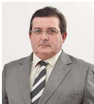
Armindo Sesar Tassi Prefeito de Massaranduba