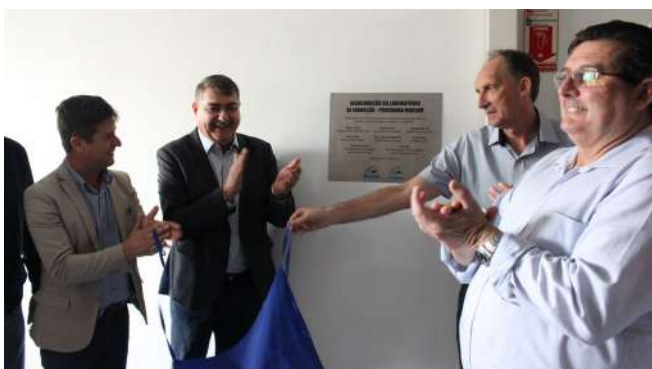
Inauguração do Laboratório