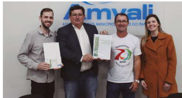
Entrega do Diagnóstico Socioambiental de Guaramirim