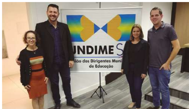
Representantes do Colegiado de Educação da Amvali em formação para o novo Currículo Base de Educação

Com 450 páginas o currículo reúne as novas diretrizes e especificidades do ensino para o Estado, após cinco anos da última atualização. Ele engloba as dimensões de Educação no Campo, Ambiental, Indígena, Quilombola, Educação Especial e Educação de Jovens e Adultos. Nas novas diretrizes, todas essas dimensões são articuladas no percurso formativo, da educação infantil até as séries finais do Ensino Fundamental. Com a capacitação, os representantes serão multiplicadores desse novo currículo aos professores da rede municipal dos municípios da Amvali.