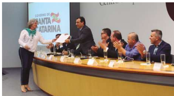
Entrega do Ofício ao Governador de Santa Catarina, Carlos Moisés