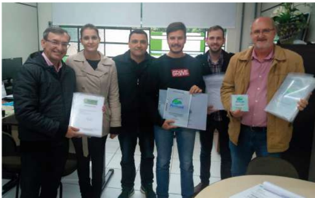
Entrega do projeto Casa do Professor

A estrutura que antes era utilizada como abrigo pela Secretaria de Assistência Social, passará por reformas e adequações para receber a Casa do Professor. Para viabilizar os processos de licitação e início das obras, a Amvali contribuiu com o desenvolvimento do projeto executivo. O pedido veio a partir da necessidade de diversas adequações no prédio para a realização dos trabalhos uma equipe multidisciplinar.