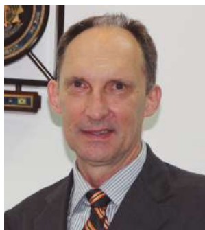
Osvaldo Jurck Prefeito de Schroeder