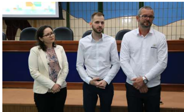
Representação do Colegiado em Tocantins