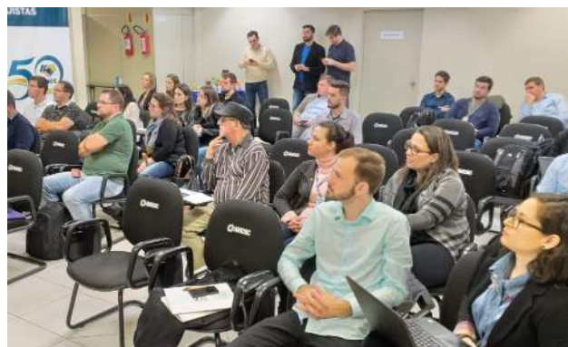
Reunião do Colegiado em Chapecó