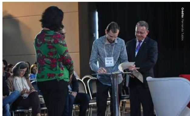
Assinatura do Termo de Cooperação entre FECAM e CAU/SC.