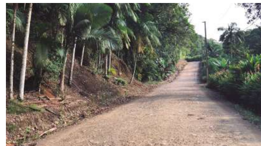
Rua Alberto Zanella