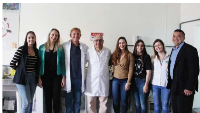
Equipe Amvali e CIGAMVALI