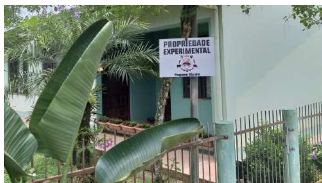
Áreas testes identificadas