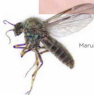
Maruim ( Culicoides )