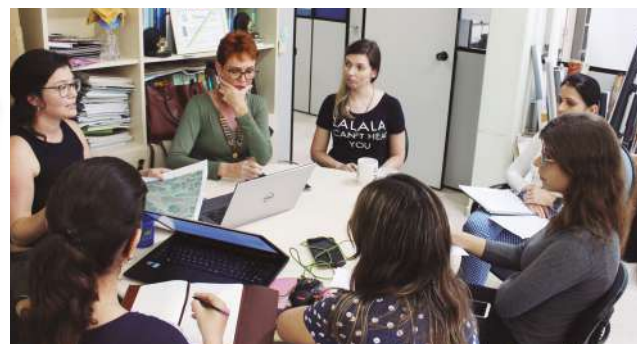
Equipe técnica responsável pelos diagnósticos