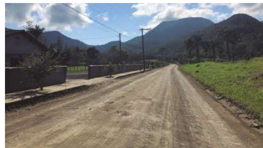
Estrada Duas Mamas