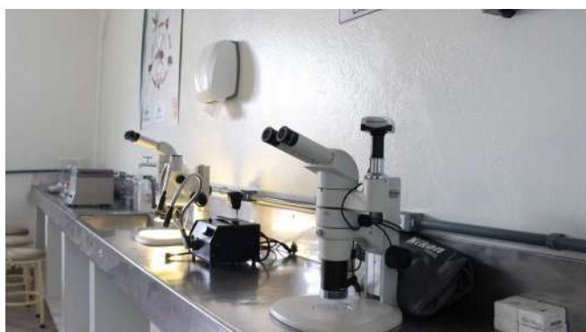
Laboratório de Inovação - Programa Maruim