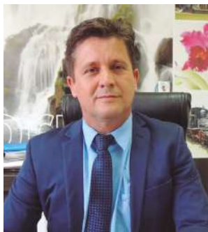
João Carlos Gottardi Prefeito de Corupá