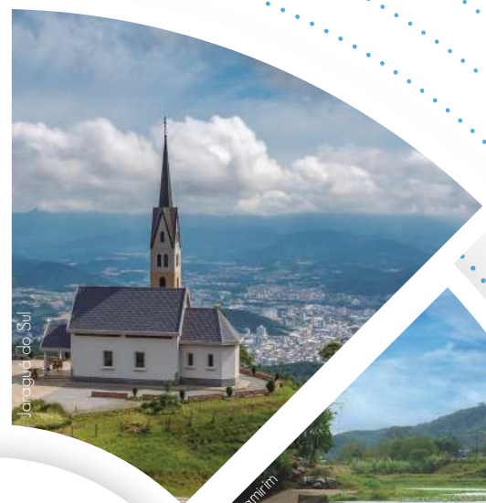
Jaraguá do Sul