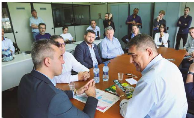
Em visita à Jaraguá do Sul, o Secretário de Estado da Casa Civil Douglas Borba se reuniu com lideranças políticas para avaliar situação da BR-280 e SC-108.

Além disso, o trecho comporta várias linhas de ônibus, tanto intermunicipais quanto urbanas e ainda, por se tratar de área urbana, a circulação de pedestres e ciclistas é também intensa. Em decorrência destas características, a rodovia apresenta, elevado fluxo de veículos e conseqüentemente, problemas de congestionamento em diversos horários do dia, bem como elevados registros de acidentes de trânsito. Infelizmente a obra de duplicação do trecho urbano é um assunto de décadas.