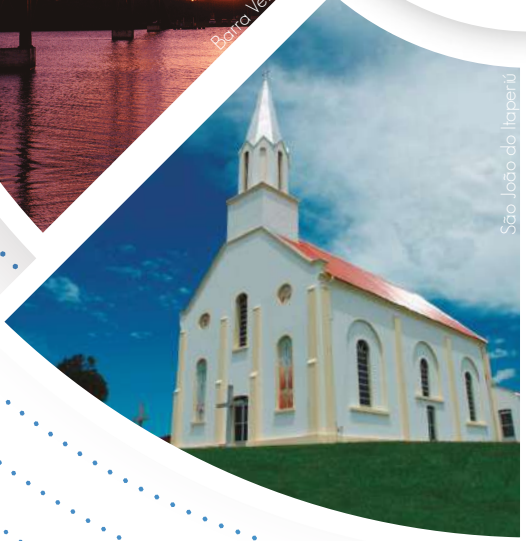
São João do Itaperiú