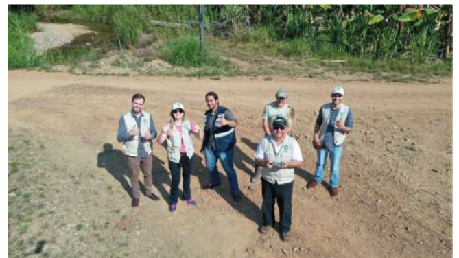
Teste de drone em propriedades