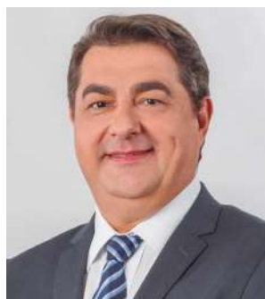
Antídio Aleixo Lunelli Prefeito de Jaraguá do Sul