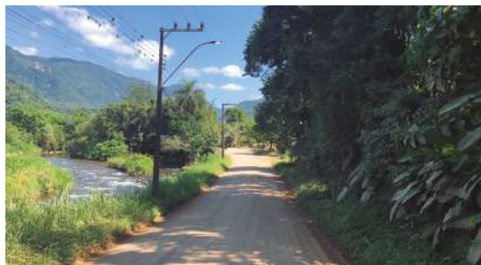
Rua 23 de Março

Em 2019, a Amvali realizou a entrega de aproximadamente 10,5 km em projetos de pavimentação para Schroeder, totalizando 8 ruas. Confira algumas delas: