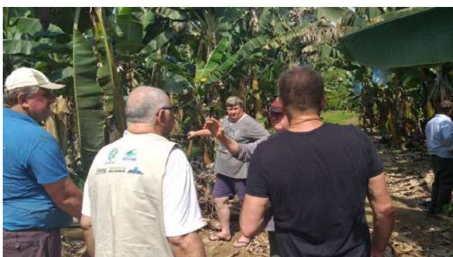
Escolha das áreas experimentais