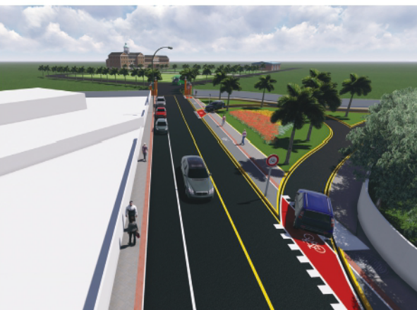
Interseção e Acesso ao Seminário Sagrado Coração de Jesus, Corupá

A AMVALI também atua na consultoria de projetos de infraestrutura urbana da nossa região, elaborando projetos que visam à otimização do funcionamento das cidades. O Setor de Engenharia esteve presente na elaboração, condução e gerenciamento de vários projetos de ligações urbanas, contabilizando ao todo 4 pontes e 20 projetos de pavimentação em todos os municípios da AMVALI.