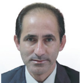
CLAUDEMIR MATIAS FRANCISCO Conselheiro Fiscal Efetivo Prefeito de Barra Velha