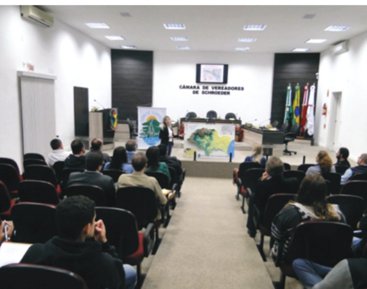
Palestra na semana do Meio Ambiente, em Schroeder

A programação especial de celebração da Festa Anual das Árvores iniciou dia 21 de setembro com palestra e trilha nas cachoeiras da RPPN Emílio Battistella em Corupá. Ainda em parceria com a FUGAMA e SAMAE de Jaraguá do Sul ocorreram palestras e dinâmicas em cinco escolas municipais.