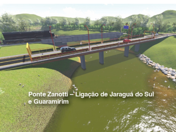
Ponte Zanotti – Ligação de Jaraguá do Sul e Guaramirim