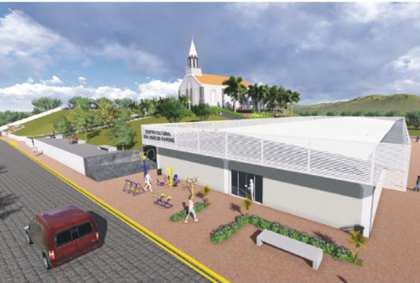
Centro de Eventos de São João do Itaperiú

Foi desenvolvido ao longo do ano, vídeos e imagens em perspectiva de cada novo projeto para apresentação e mobilização da comunidade. Ao todo foram realizados aproximadamente 11 vídeos de mobilização e apresentação de projetos.