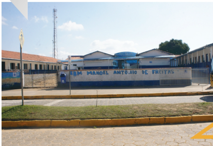
Escola Manoel Antonio de Freitas

O programa de regularizações, reforma e ampliações, em desenvolvimento na AMVALI, tem como objetivo oferecer maior infraestrutura aos municípios através dos projetos desenvolvidos pela Associação, inclusive com auxílio na captação de recursos. Neste ano foram realizados projetos de reforma e ampliação de Escolas, Quadras de Esporte, Unidades de Saúde, Praças e Prédios Públicos.