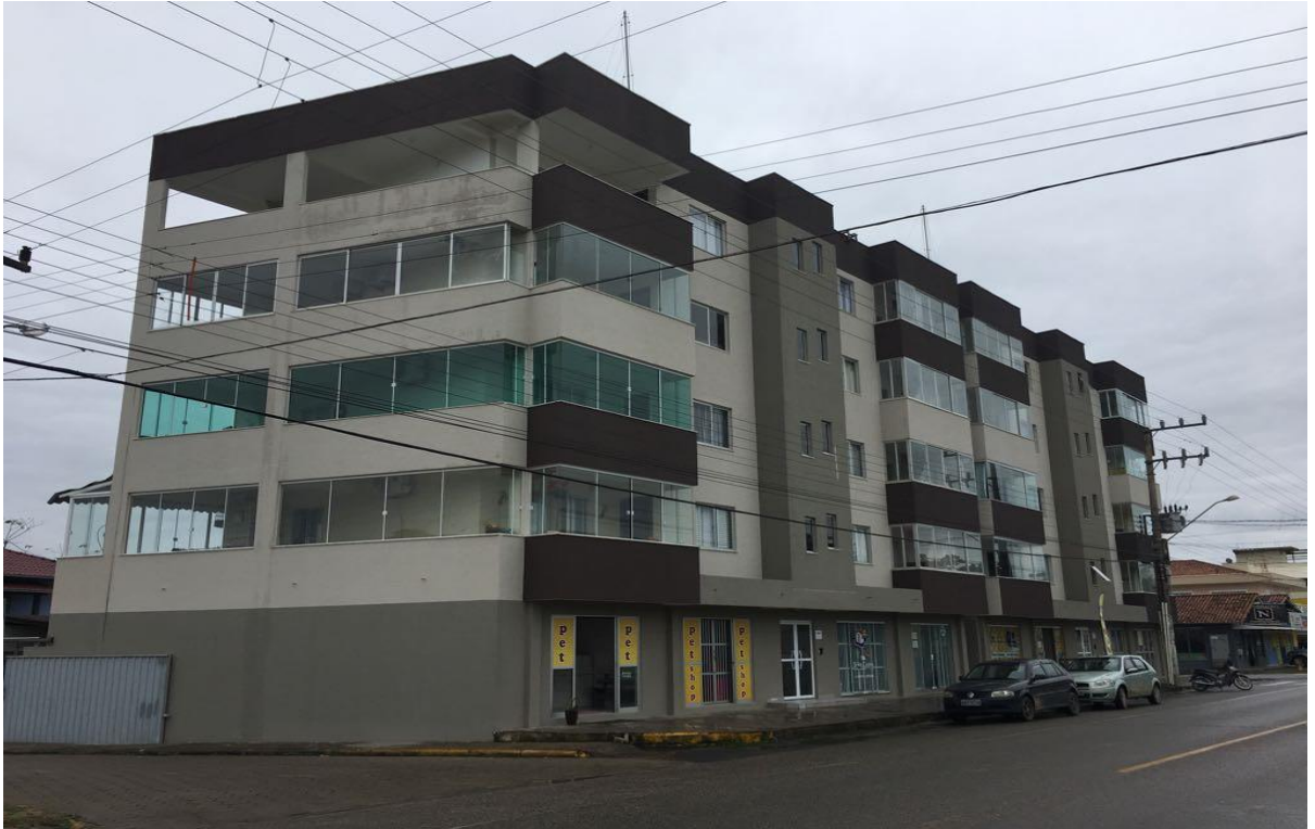
EDIFICIO SUZANA – ITAJUBA – BARRA VELHA -