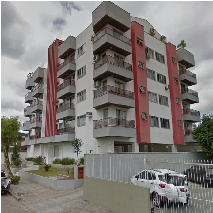
EDIFÍCIO MONTE HERMON – JOINVILLE