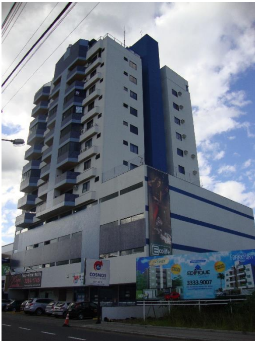
EDIFÍCIO LUGANO - INDAIAL