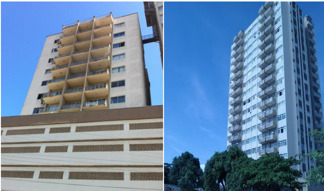
EDIFICIO ANNA PAULA – CENTRO – PIÇARRAS Obs: esta pintura já possui 11 anos.