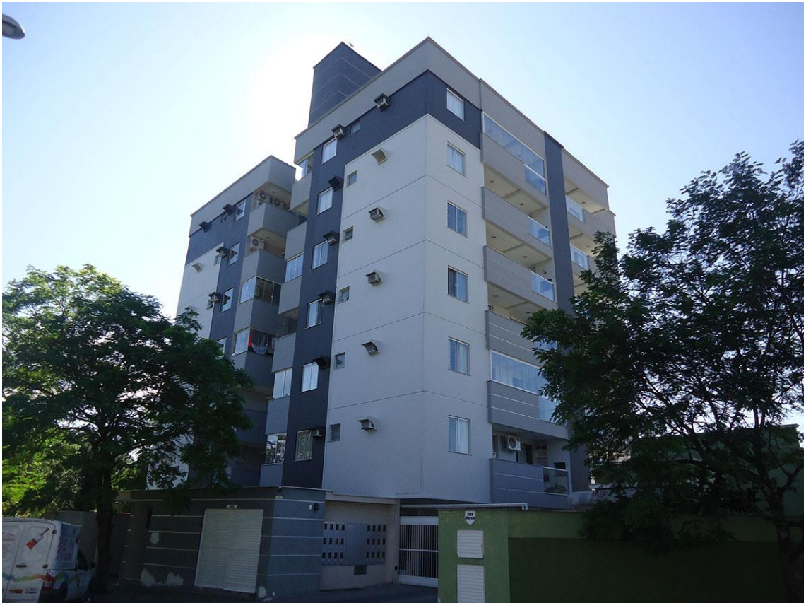
Edifício REAL PARQUE – JARAGUA DO SUL – BAIRRO VILA NOVA

Segue algumas obras executadas pela nossa empresa: