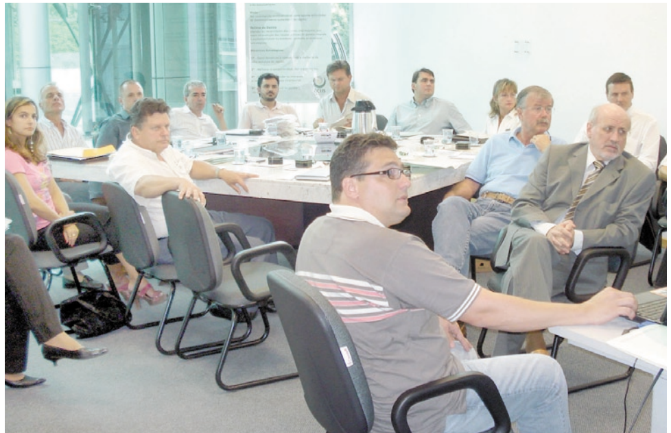
Equipe Técnica e Diretoria da Amvali com a Diretoria da Acijs