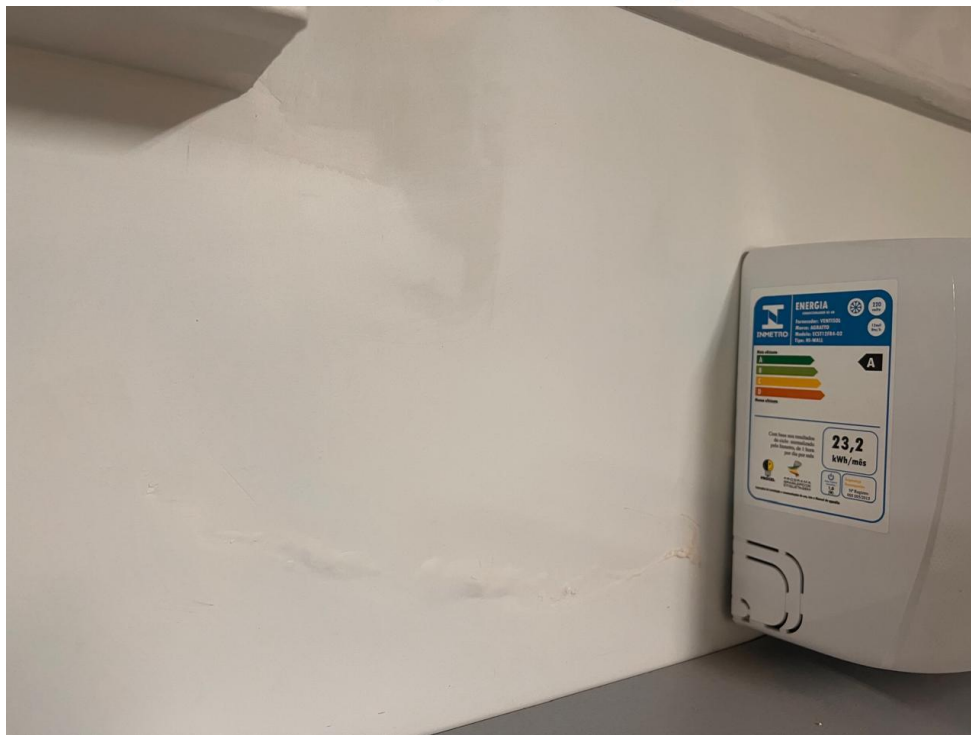
Ar condicionado novo